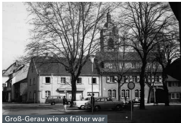
Groß-Gerau wie es früher war